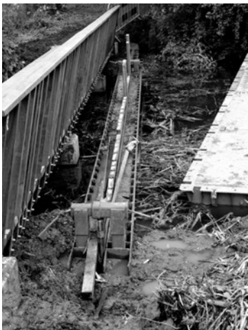
Plaatsing van het nieuwe schot

Enkele weken geleden is er een nieuwe brug geplaatst bij de vijver ter hoogte van de parkingang aan de Waterlinieweg. De oude brug was aan vervanging toe. Tegelijk met de nieuwe brug is het schot