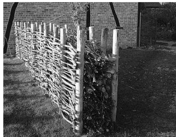
Voorbeeld van takkenril