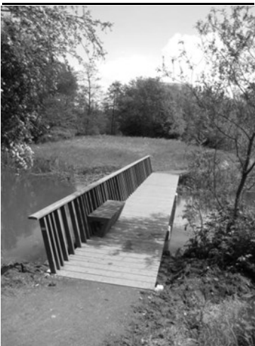
De nieuwe brug

vervangen dat het water van de Grift scheidde van het vijverwater. Dat schot moet ervoor zorgen dat het (vervuilde) water van de Grift niet in het park komt. De bedoeling was om het oude schot weg te halen wanneer het water in de Grift lager stond dan in de vijver. Door miscommunicatie is dat echter niet gebeurd, waardoor ook modder in de vijver is terechtgekomen. Op ons verzoek is vervolgens een pomp geplaatst, die enkele dagen lang vijverwater naar de Grift heeft teruggepompt, waardoor het waterpeil in de vijver lager werd. Inmiddels is het peil door het grondwater weer gestegen tot het oude niveau.